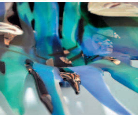
Detalje fra Åkandefadet.